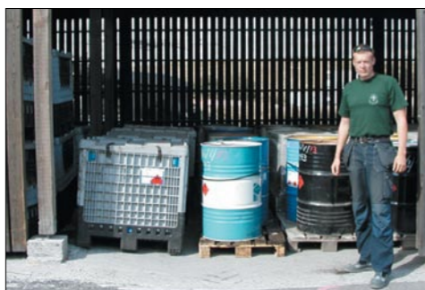
Vår kemist tar hand om företagens farliga avfall. Han analyserar produkterna så att de går iväg till rätt behandlingsanläggning.

Anläggningen för företagens farliga avfall är öppen måndag till fredag 07.00-15.30 med lunchstängt 11.30-12.15. Anmäl din ankomst vid kundmottagningen. Personalen förser dig med nödvändiga dokument och du får vidare anvisningar.