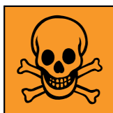
Mycket giftig/ Giftig